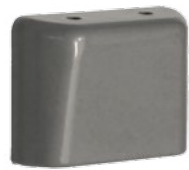
1. Montera väggfäste / linjal

Väggfäste monteras med den förmonterade tejpens och linjalerna ska skruvas fast.